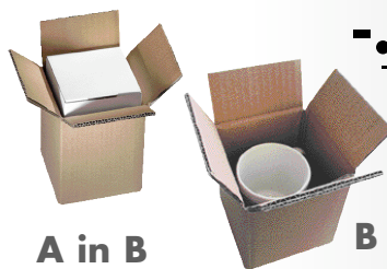
A in B