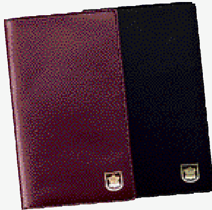
Ausführung Rindleder ARGENTINA

Siena 2.40 Asphalt 297 559 793 Dunkelblau 297 559 803 Beige 297 559 813 Mit Jahres-Blindprägung