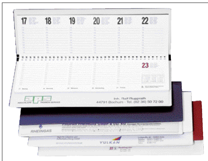
Ausführung Folieneinband BASIC CLASSIC 00-01-02-05

-,25 S ab 100 Stck. 300 x 25 mm Fußleiste