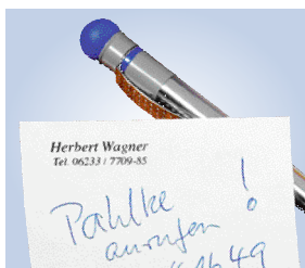
Einzel-Namensdruck und Einzelblatt-Druck auf Anfrage