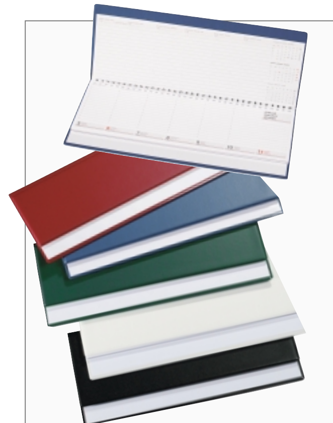
Ausführung CLASSIC COLOURS