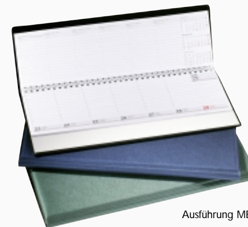
Ausführung METALLIC glatt