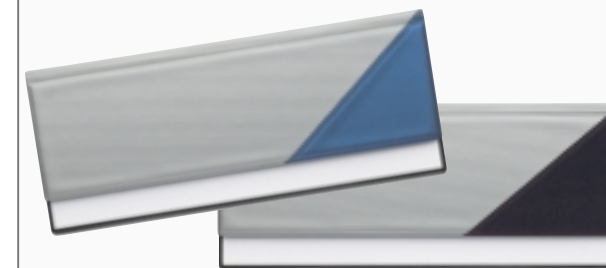
Ausführung METALLIC TRIANGLE mit prägefähiger Ecke