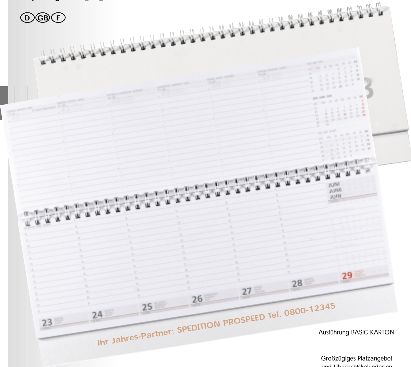
Ausführung BASIC KARTON

Großzügiges Platzangebot und Übersichtskalendern